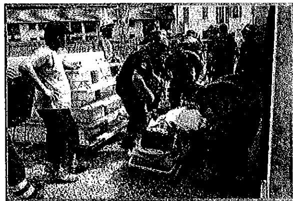
Le operazioni di soccorso all'operaio caduto nello scavo di via Villafranca

Ennesimo infortunio in via Villafranca alle 10, un muratore precipitato in uno cantiere edile, è s' dale dai soccorritori le sue condizioni vi.