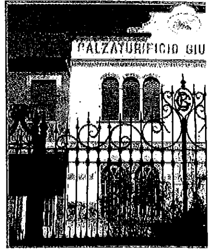
L'ex calzaturificio è avvolto dal degrado: co